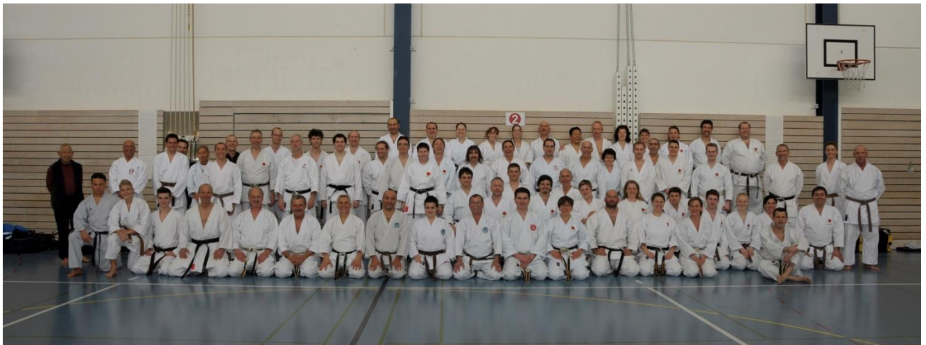
Erster Kurstag 17. März 2012 in Leuggern