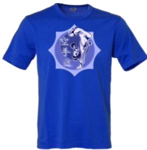
Neu: SKR Kinder T-Shirt

Es ist vollbracht! Im 2012 startet das neue SKR-Angebot für Kinder mit zwei Zentraltrainings. Diese Termine muss man unbedingt dick in der Agenda anstreichen.